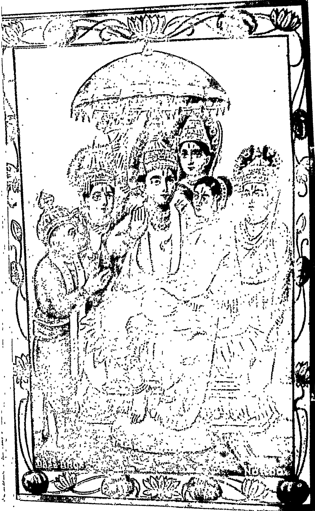
आसाद्य नगरीं दिव्यामभिषिक्त्याय मीतगा ।